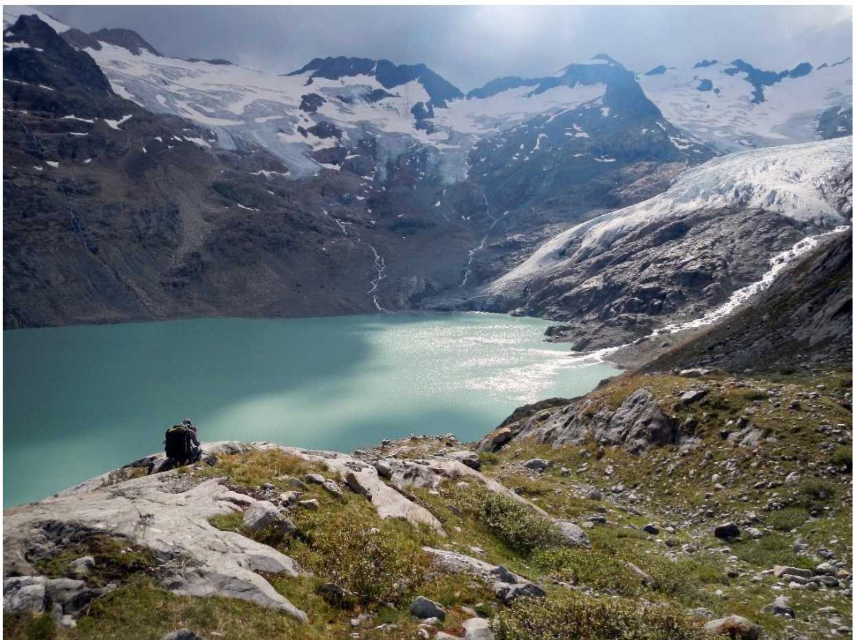
Gauligletscher 2013

(ガウリ氷河の長さ : 1850 年=9.2km, 1973 年=6.6km, 2009 年=5.7km 1850 年から 2009 年の 159 年間に 38% の氷河が後退。Ref: Käsermann C. & Wipf A., 2011: 66)