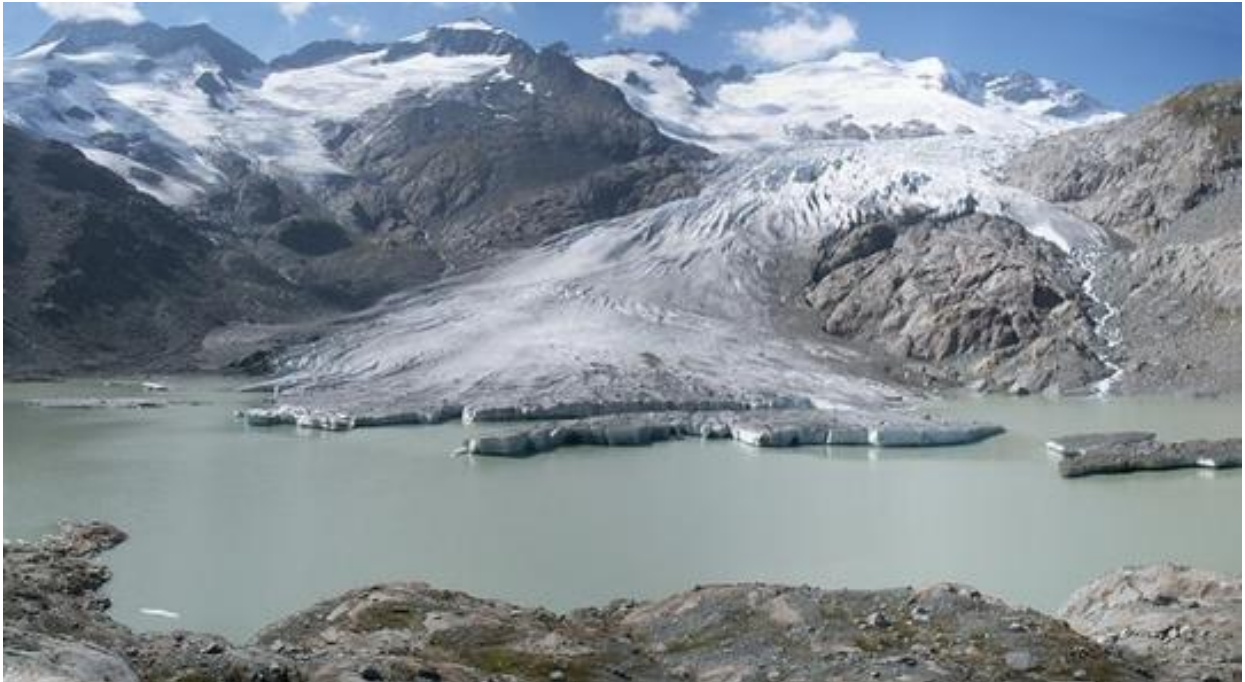
Gauligletscher 2007

ガウリ氷河は、2005年の記録によれば、6.2 km。ベルン州、ベルナー・アルプスに位置し、標高 2,146m の湖に流れ込んでいる。近年の写真を年毎に並べてみると、氷河が年々後退し、湖がどんどん大きくなっていることが一目瞭然で、恐ろしくなる。